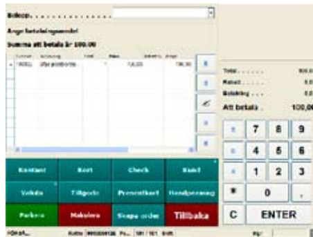
Gränssnittet för kassaapplikationen med möjligheter för betalning, orderskapande med mera.

I systemet ingår den oundgängliga kassa-applikationen, som kan startas i samma miljö och användas som alla andra komponenter i systemet. Kassaapplikationen går att använda med både tangentbord och touch-skärm. Kassaapplikationen är snabb, tillförlitlig och kraftfull.